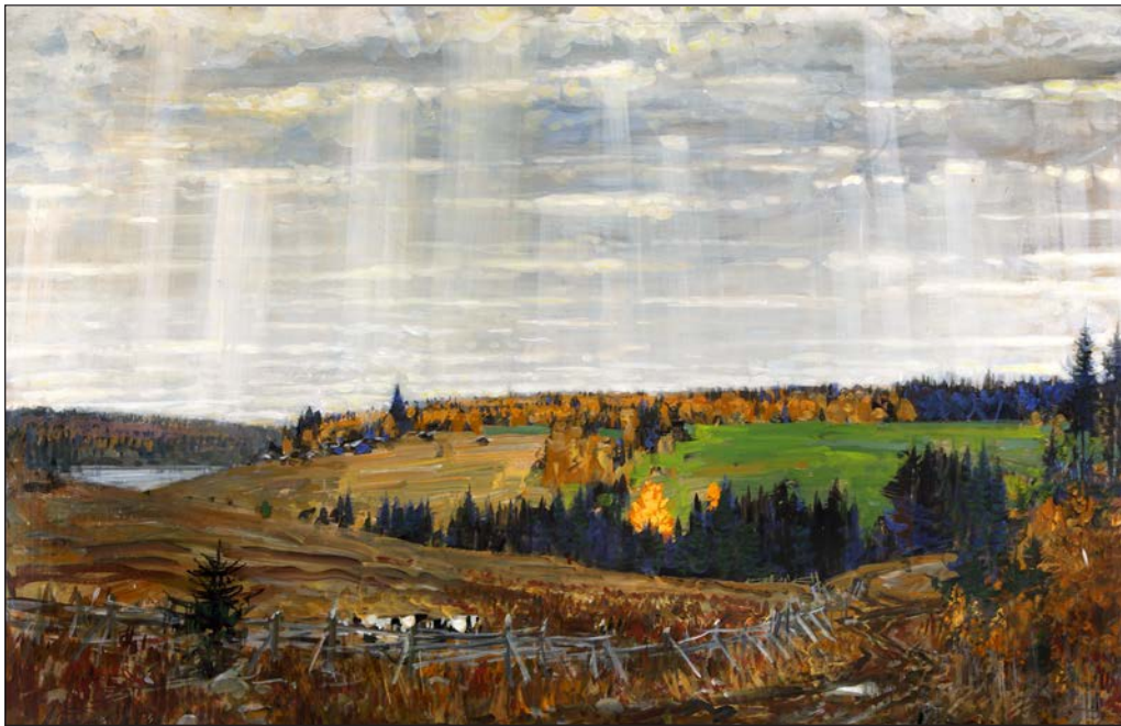
Народный художник России Михаил Абакумов . Торжественная осень

В пейзаже «Торжественная осень» Михаил Георгиевич Абакумов изображает ту же местность, что и в этюде «Светлый день», но берёт дальнюю точку обзора. На переднем плане появляется пастбище с коровами, формат чуть шире, и уже больше виднеется водоём вдали. Тот же вид, но другое время года и совсем иное настроение. Косые склоны уводят взгляд зрителя к озарённому солнцем холму, где над сизыми избами золотится осенний лес, а жухлая трава контрастом оттеняет свежую зелень озимых. Но самое главное в картине – это свет. Он потоками льётся сквозь облака, освещая и освящая русскую землю.