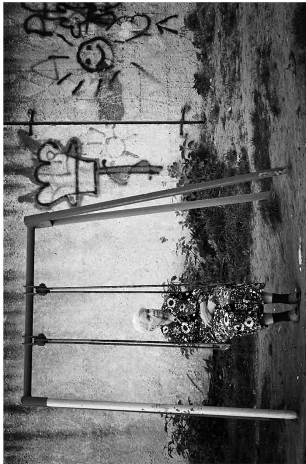
Пока внук в школе