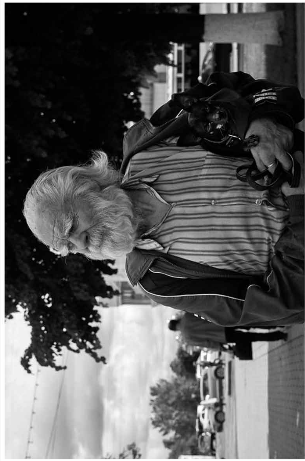
В деревню на лето